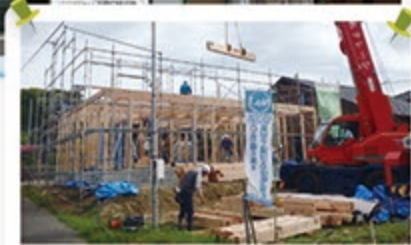
4月29日に上棟しました！