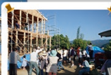
5月31日上棟。もちまきました！