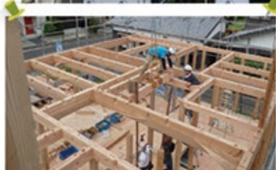
太い柱、梁。頑強な造りです！