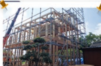
柱や梁が組み上がっていく様子は、とても迫力があります。